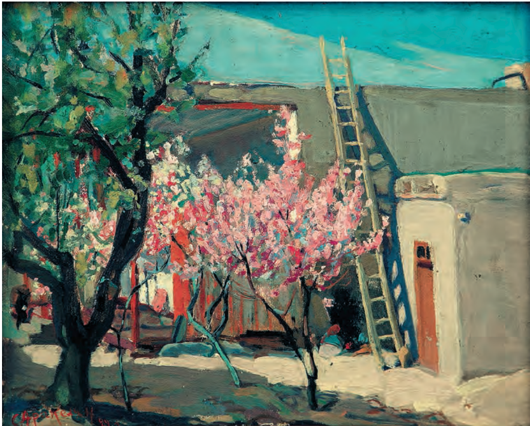
Կտավ, յուղաներկ 25 x 31 սմ