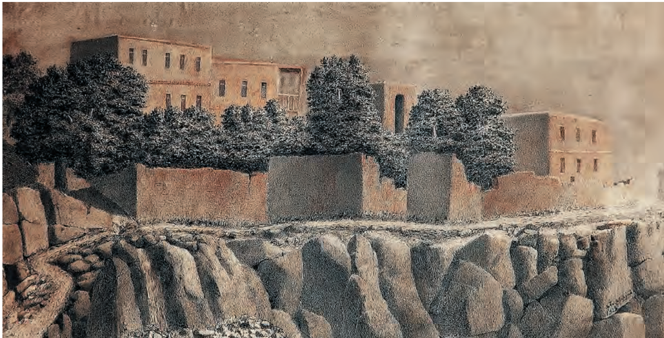
Խառը տեխնիկա 24 x 46 սմ