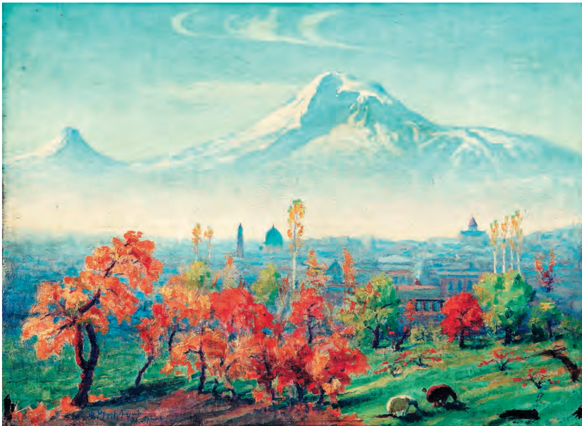
Ստվարաթուղթ, յուղաներկ 60 x 80 սմ