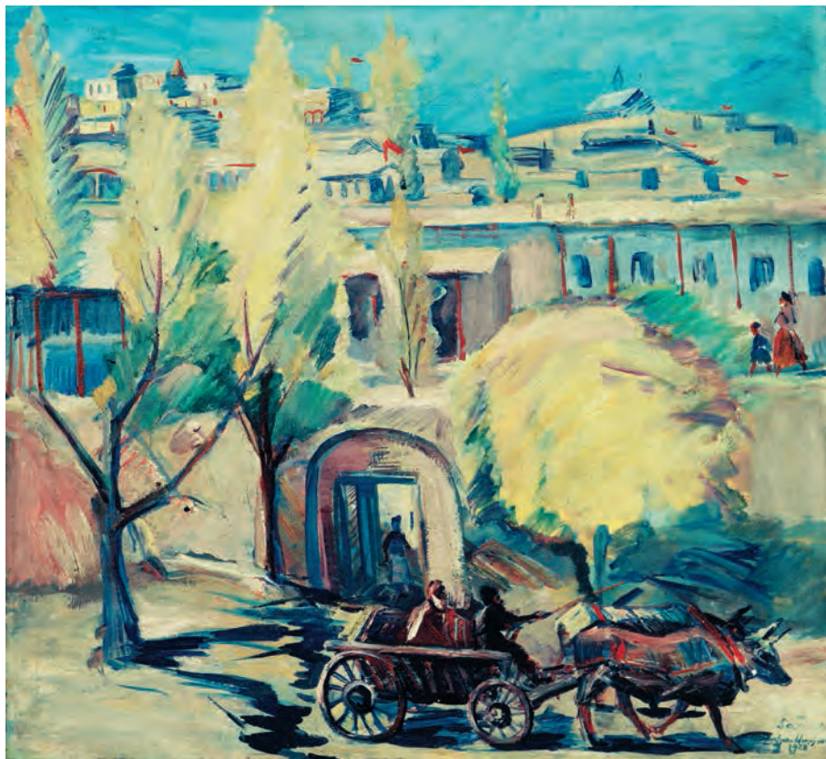
Կտավ, յուղաներկ 66 x 70 սմ