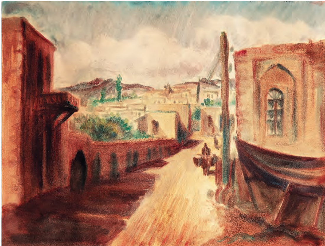
Թուղթ, ջրաներկ 22 x 30 սմ