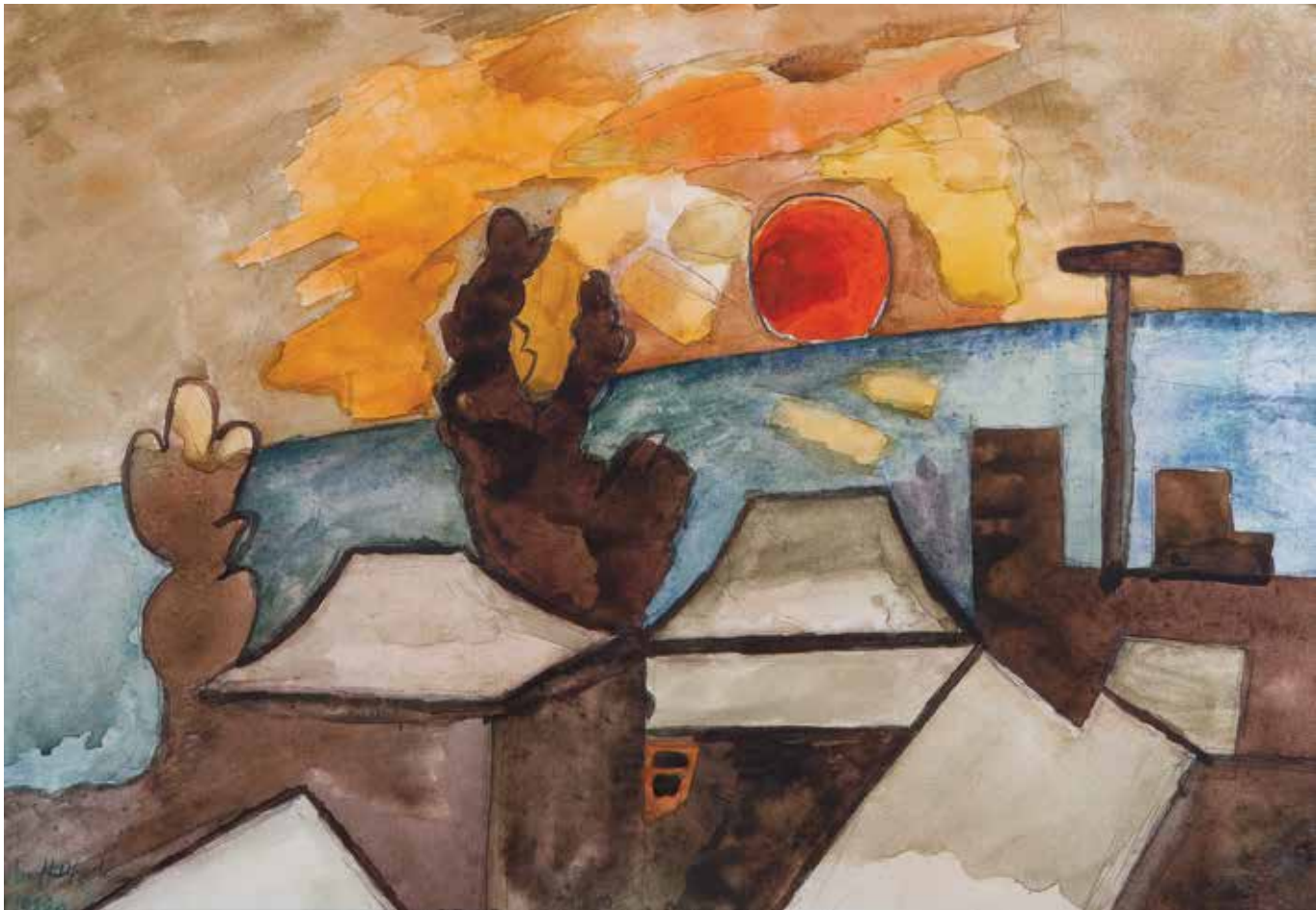
Մայրամուտ | Sunset | 1980