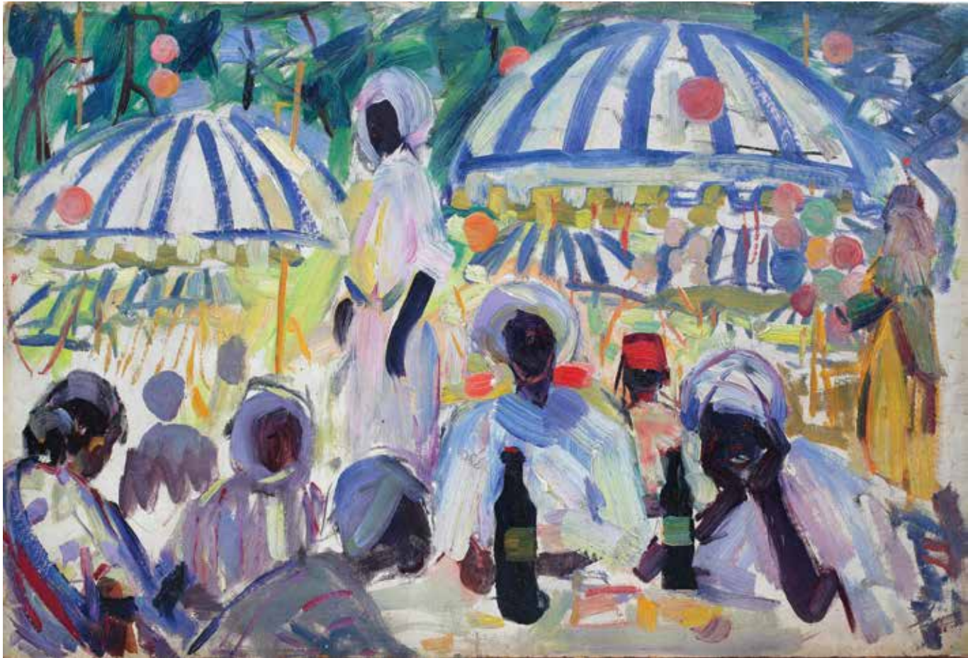
Միջազգային ուսանողական փառատոնը Մոսկվայում | World Festival of Students in Moscow | 1957