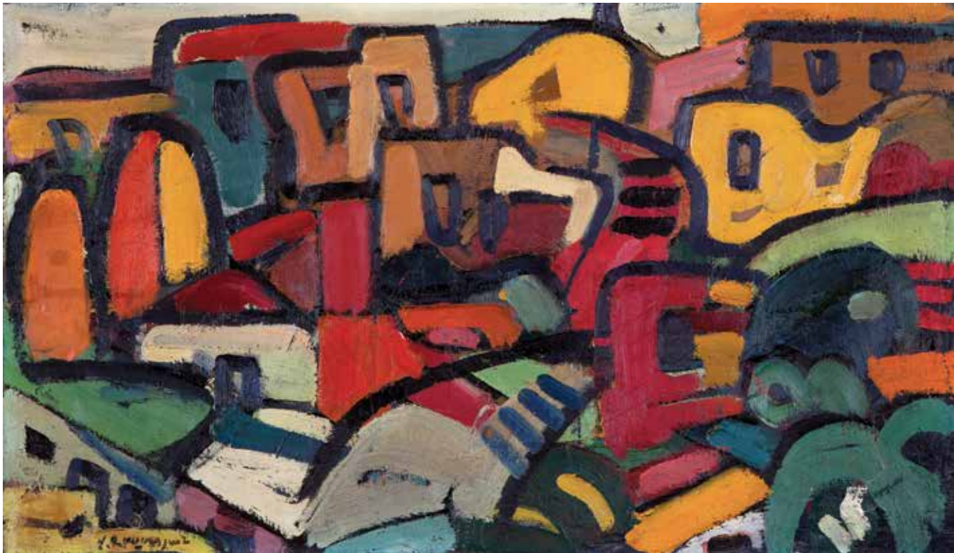
Բնանկար | Landscape | 1971