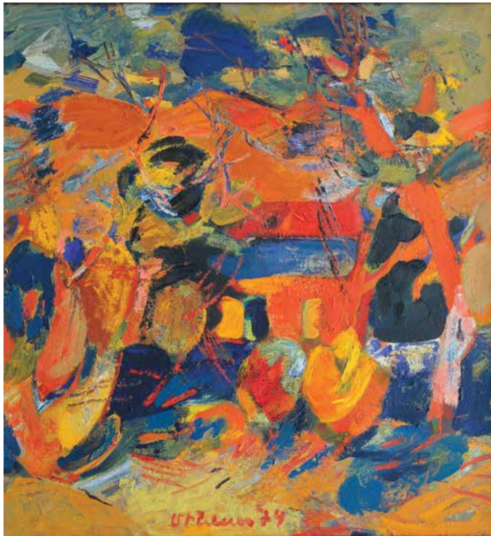
Աշնանալի տերևաթափ | Autumn Leaf Fall | 1974