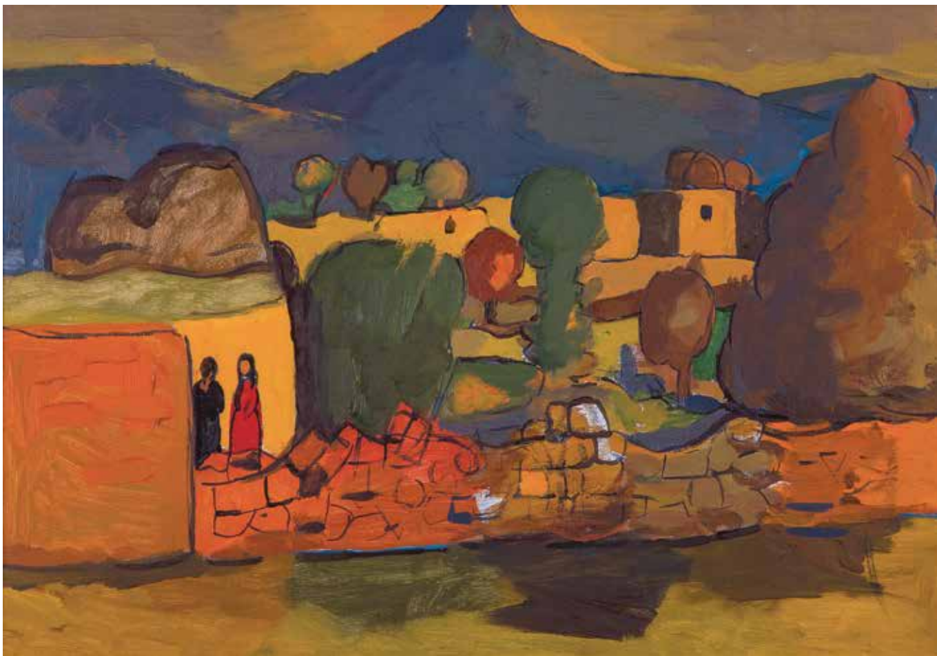
Աշունը Մայիսյան գյուղում | Autumn in the village Mayisyan | 1985