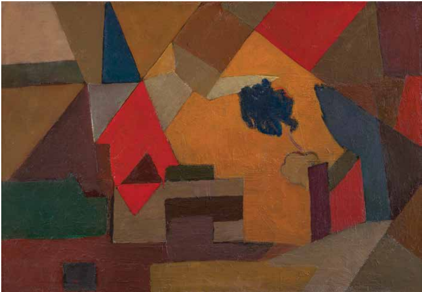
Կոմպոզիցիա | Composition | 1974