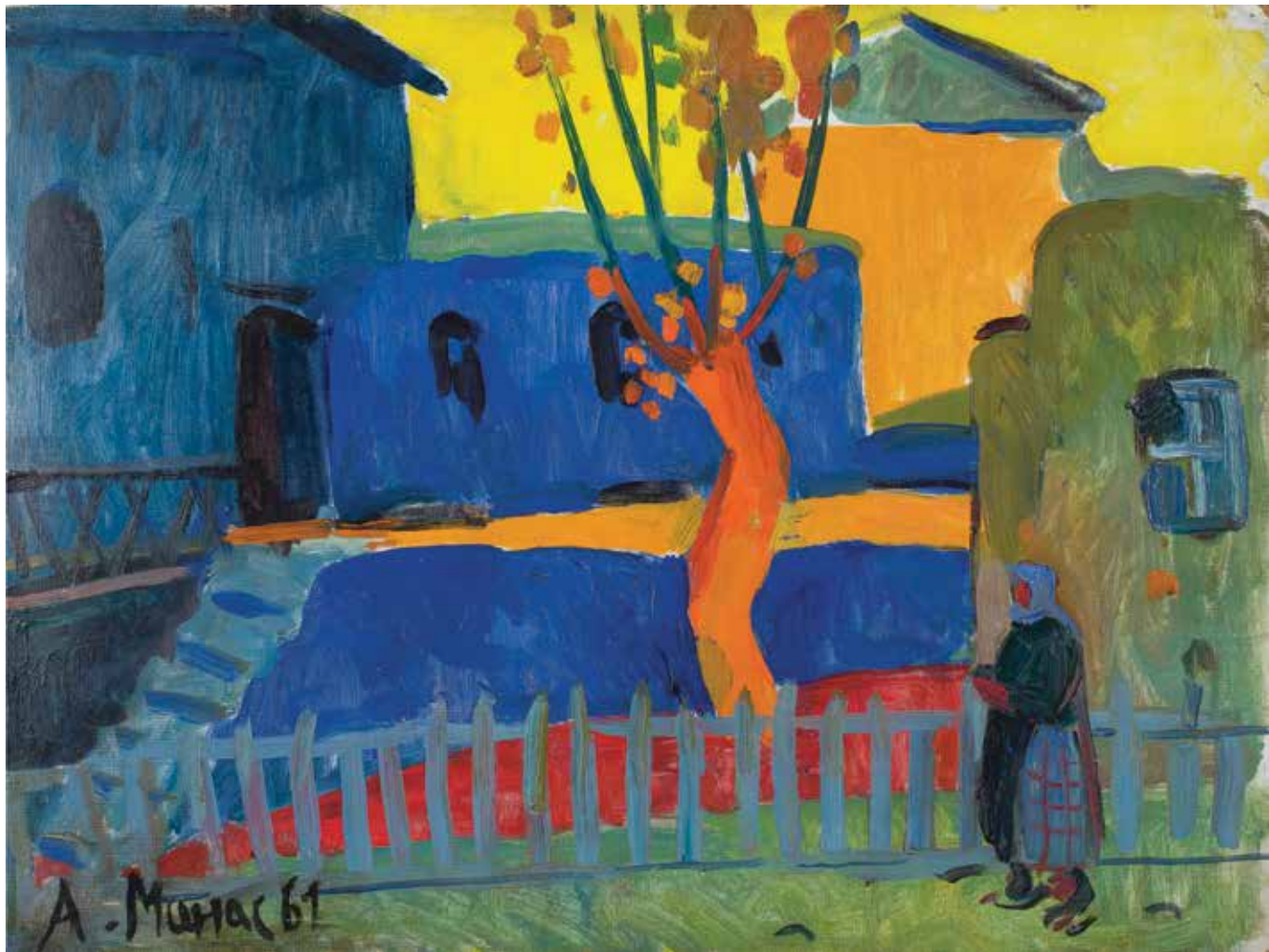
Գյուղ. Երեկո | Village: Evening | 1961