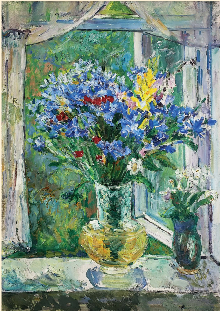
11. Նադեժդա Ուդալցովա (1886-1961) Մաղիկները պատուհանի վրա, 1946 Կտավ, յուղաներկ, 72 x 52 սմ