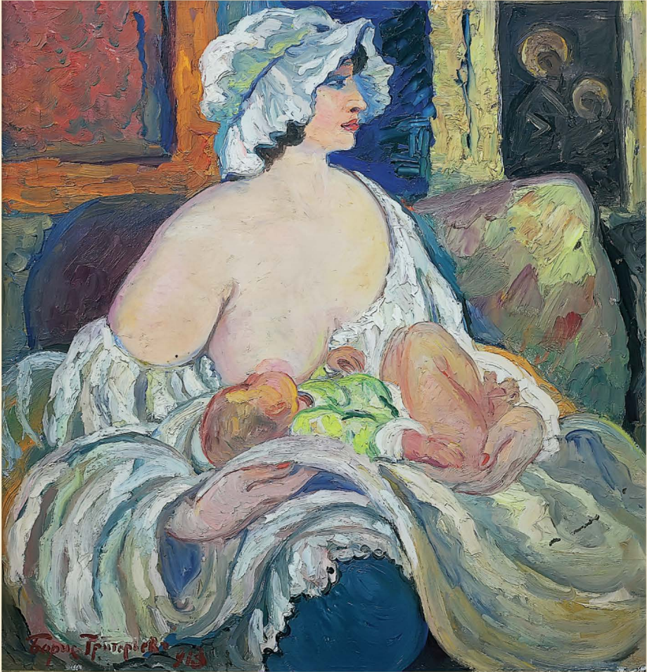
3. Բորիս Գրիգորև (1886-1939) Մայրն ու մանչուկը , 1913 Փայտ, յուղաներկ, 60 x 57.5 սմ