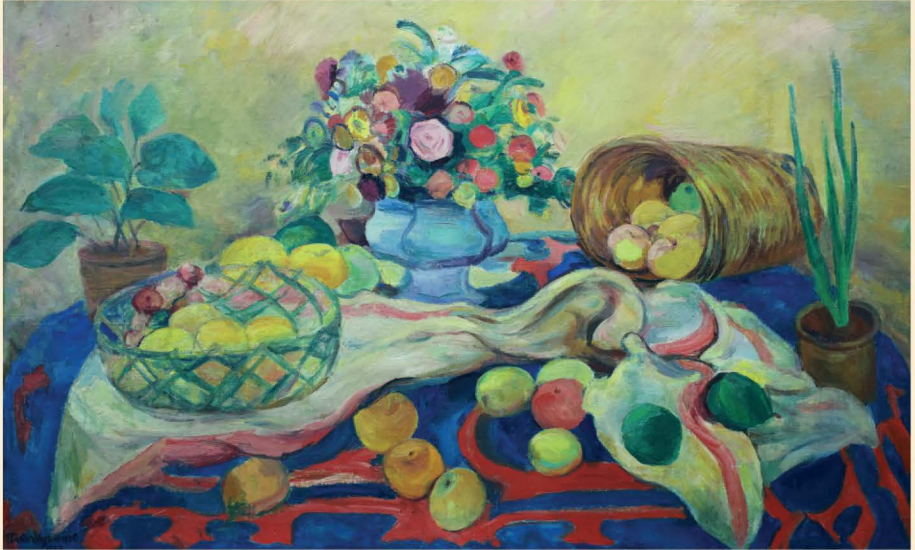
6. Պավել Կուզնեցով (1878-1968) Նատյուրմորտ. Ծաղիկներ և մրգեր, 1933 Կտավ, յուղաներկ, 65 x 103 սմ