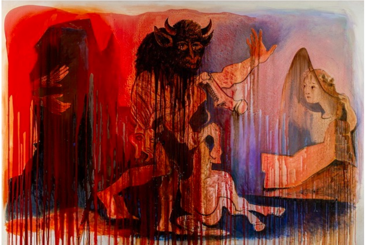
Կտավ, խառը տեխնիկա 120 x 140 սմ